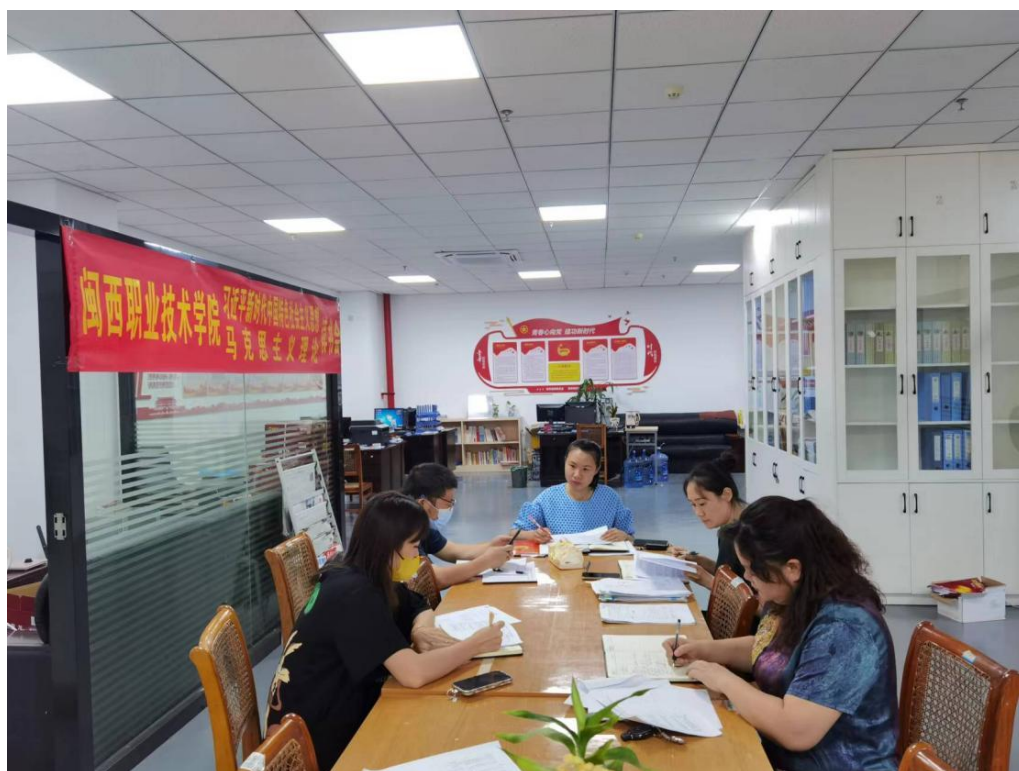
（图为校团委召开师德师风培训会）

会议要求全体成员加强沟通，做好本职工作，互帮互助，以饱满的精神状态为“师德师风建设年”增光添彩。