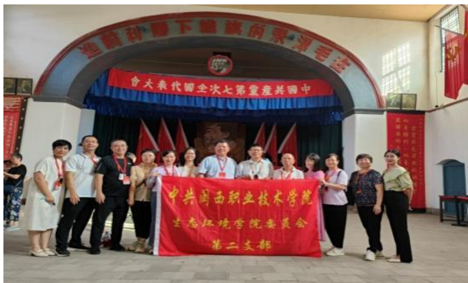
(图为实践研修过程)

立崇高理想信念，坚定永远跟党走信心和决心，把立德树人融入思想政治教育，努力提高思政课教学质量，为推动学校高质量发展作出思政课教师应有的贡献。