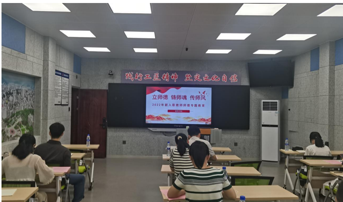
（图为新入职教师进行师德师风教育）