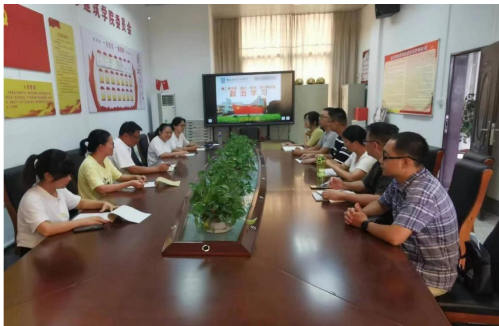
(图为城乡建筑学院开展师德警示教育活动)

职业行为十项准则典型案例》，强调要树立底线意识、红线意识，以典型案例为鉴，警钟长鸣，时刻做到自重、自醒、自警、自励。引导教职工坚守为党育人、为国育才的初心，自觉遵守《新时代高校教师职业行为十项准则》，持续加强师德锤炼，努力涵养高尚师德，始终做到立师德、铸师魂、传师风。