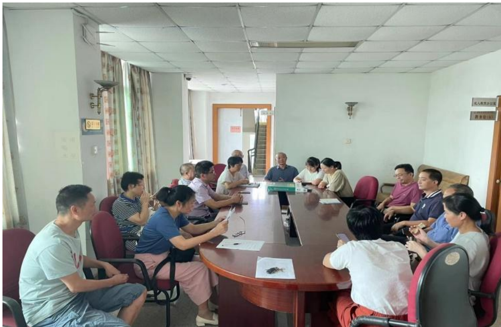
(图为卫校开展师德警示教育活动)