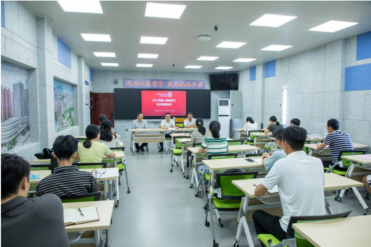
（图为 2022 年新入职教师校内岗前培训开班仪式）

为帮助新入职教师尽快融入新环境、适应岗位要求，教师工作处协同相关部门精心组织本次培训。教师工作处负责人以《从“好老师”到“大先生”——高职院校教师的专业发展与职业成长》为题为新入职教师上第一课，介绍教师专业发展的内涵与成长的阶段，希望新入职教师提高站位、强化锤炼、终身学习，努力成为“好老师”与“大先生”，做“‘经师’与‘人师’的统一者”。教务处负责人向新教师阐述学校办学定位、办学模式、人才培养模式、人才培养规格、闽大观等学校发展模式的内涵，从高职学生生源、职业教育改革等方面分析职业教育特点，解读学校相关教学管理制度，对新教师注学校之魂，为新教师立职教之情，为新教师明教法之路。教师工作处、科研处、信息中心等部门工作人员向新入职教师介绍学校师德师风、学校专业技术职务评聘与教师职业发展基本要求、学校科研项目政策与管理制度、多媒体与智慧教室的使用等内容。新入职教师在工作人员带领下参观学校校史馆，增强了对学校历史的了解。