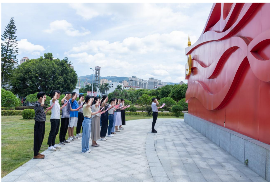
（图为新入职教师举行入职宣誓仪式）

师德教育增强了新入职教师对师德师风的认识。新入职教师表示，将牢记习近平总书记嘱托，在育人实践中锤炼高尚道德情操，在提升师德修养中落实党的教育方针，以德立身、以德立学、以德施教，自觉遵守《新时代高校教师职业行为十项准则》，立志做“四有”好教师，为建设根植中央苏区的高水平高职院校、实现中华民族伟大复兴而努力奋斗。