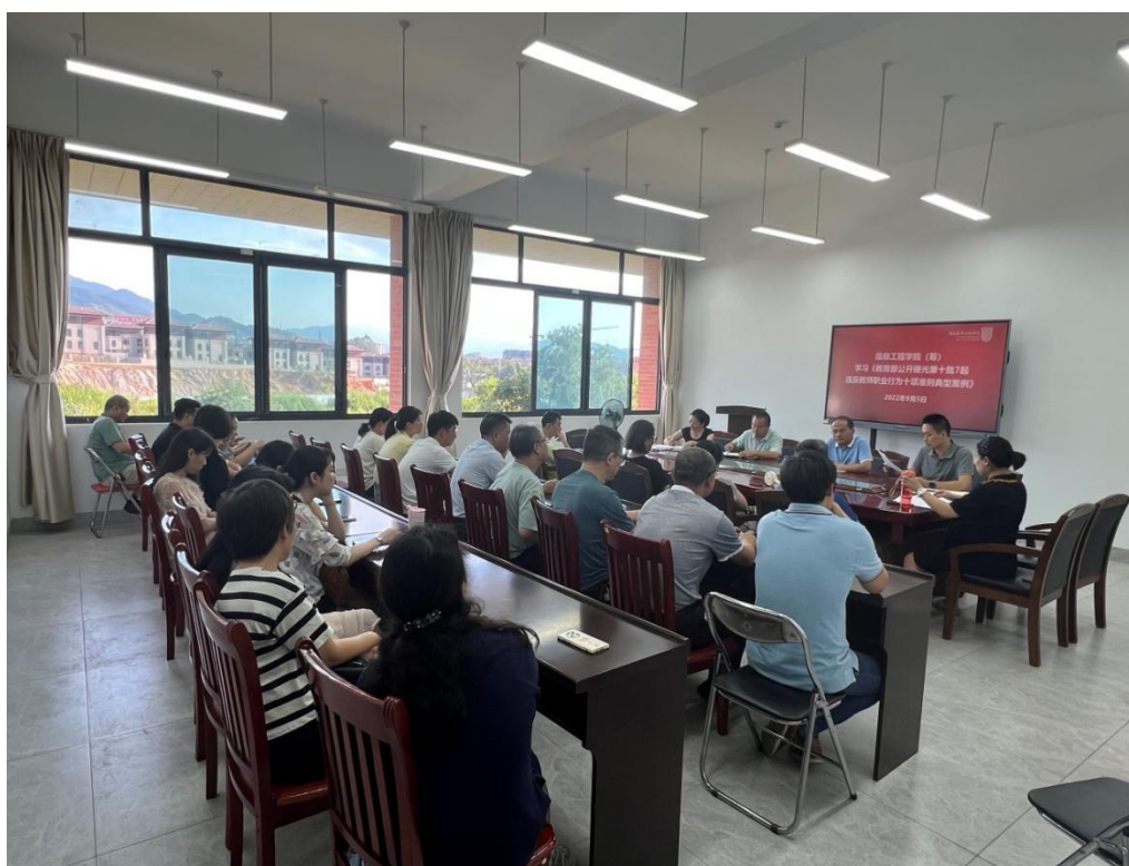
(图为信息工程学院 (筹) 开展师德警示教育活动)