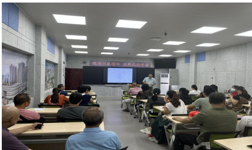
(图为公共教学部开展师德警示教育活动)