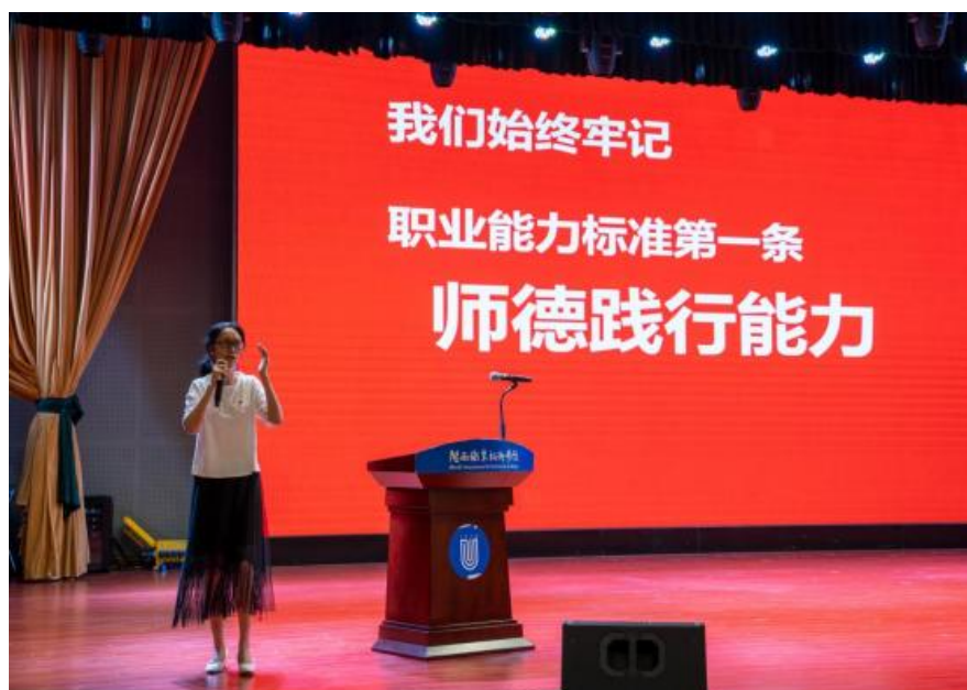
(图为教育与艺术学院开展学前教育和早期教育专业2020级学生实习动员暨安全教育会)